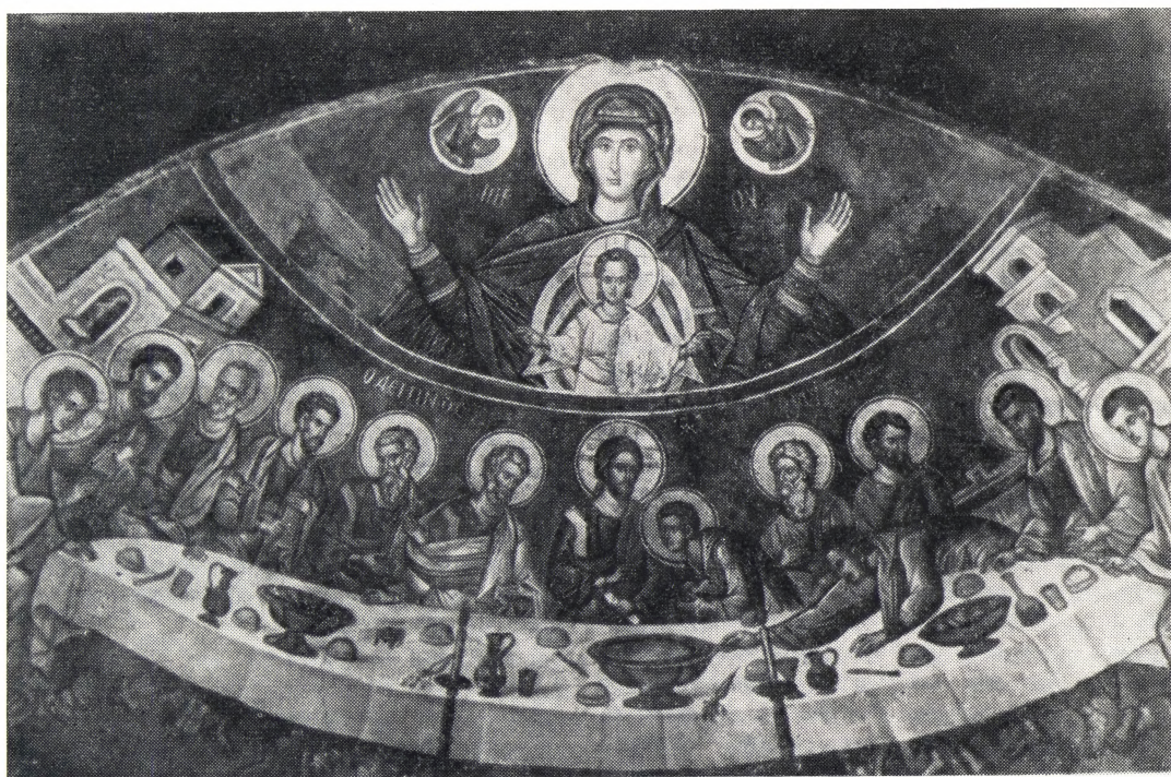
Фреска «Тайная Вечеря» Феофана Стрелитзаса из монастыря Ставроникиты [1547 год]

Здесь нередко искали молитвенного уединения и тяготевшие к Православному Востоку монахи Италии, Сицилии и других стран Запада. Тогда-то и прибыл из Рима на Афон («сопутствующий Святителем Николаем») великий столп афонского подвижничества преподобный Петр Афонский (память 12 июня).